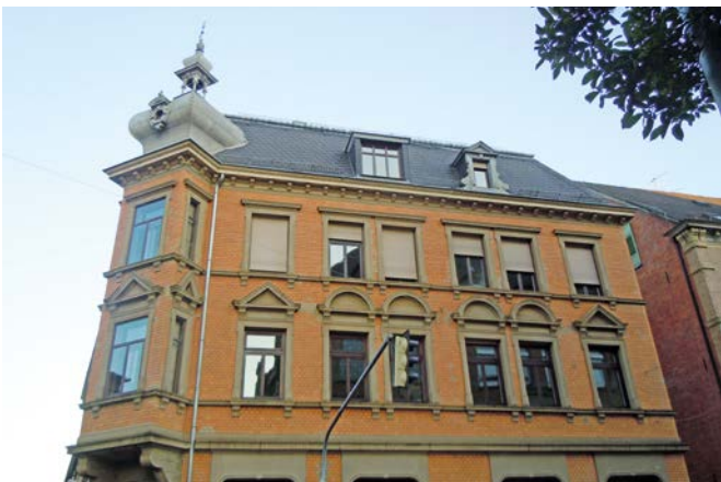
JMS (Vortragssaal, Zimmertheater) Haus Illig, Friedrich-Ebert-Straße 2